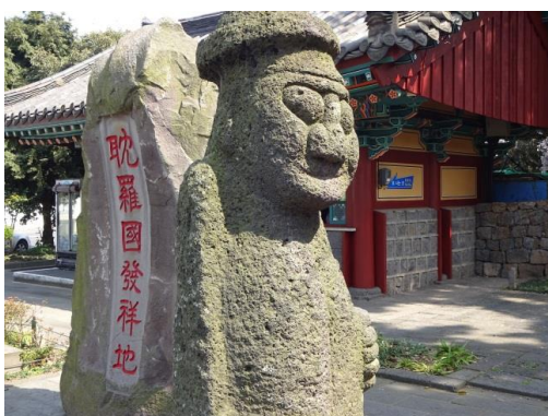
済州固有の守り神「トルハルバン」