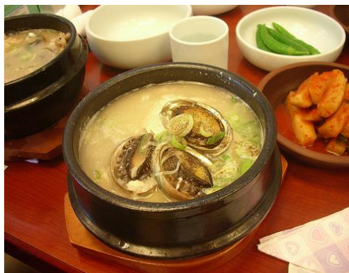
済州島名物「あわび粥」