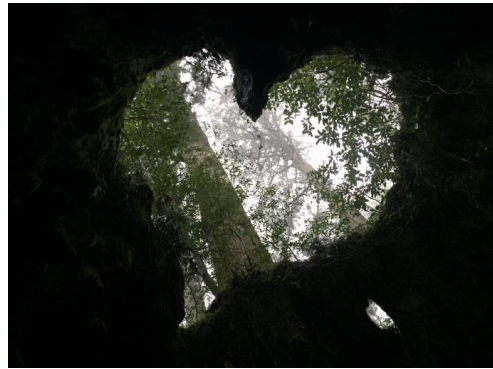
ウィルソン株 角度によってハートの形に写ります。