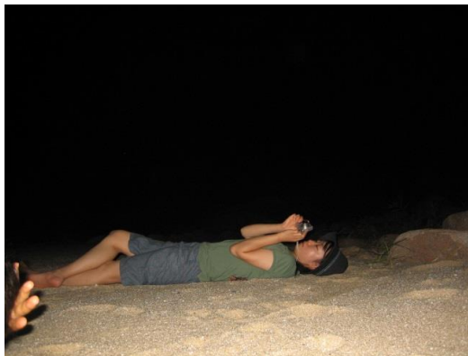
ウミガメ(季節による) & 星空ウォッチングナイトツアー