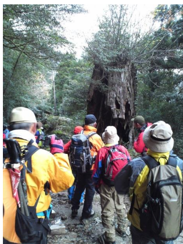
縄文杉登山 ガイドの説明を聞いています