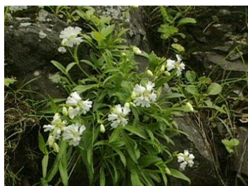
アオモリマンテマ