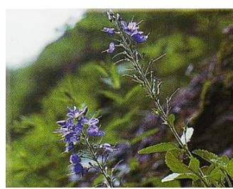
シラカミクワガタ