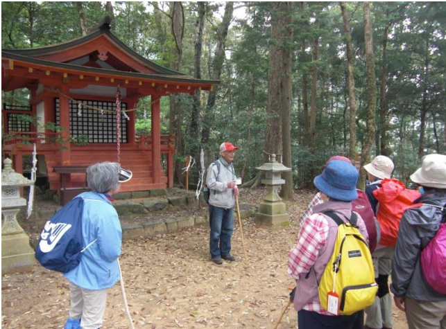
地元の語り部がご案内

超過手荷物料金 クリーニング代、電報・電話代、心づけ、追加飲食等の個人的性質の諸費用 お一人部屋追加料金 集合・解散地までの交通費・宿泊費 傷害、疾病等に関する医療費、任意の旅行傷害保険料