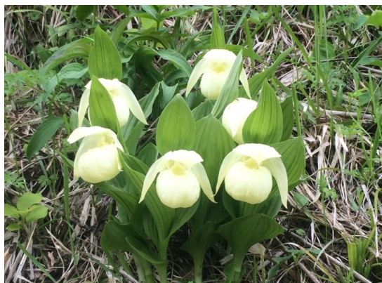
レブアツモリソウ