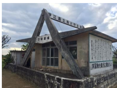
伊江島・団結道場