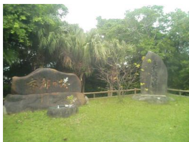
嘉数高台、京都の塔