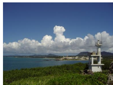
辺野古沖よりキャンプシュワブ