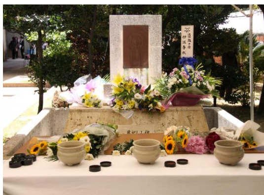
宮森小にある仲良し地藏慰霊碑