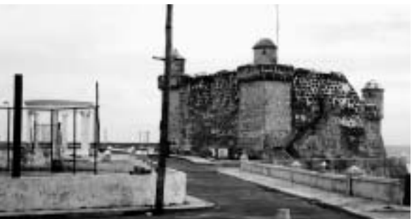
コヒマル(老人と海の舞台)

2002年1月13日(日)~21日(月) 365,000円 3月17日(日)~25日(月) 378,000円 ヘミングウェイゆかりの店やバー、「老人と海」の舞台へ魅力あふれる世界遺産のハバナ旧市街はゆったり散策 高級リゾート地・パラデロに2連泊、ゆったりとしたカリブの休日をお楽しみいただけます 今話題のラテン音楽&ダンスを「トロピカーナ」で満喫 メキシコ最大の古代宗教都市遺跡テオティワカン終日見学 成田 ✈️ アメリカ経由 ✈️ メキシコシティ(メキシコシティ泊) メキシコシティ ✈️ ハバナ 着後市内見学(ハバナ泊) ハバナ ✈️ コヒマル見学 ✈️ パラデロ(パラデロ泊) カリブ海のリゾート地パラデロでゆったり滞在(パラデロ泊) パラデロ ✈️ ハバナ「トロピカーナ」ショー(ハバナ泊) ハバナ ✈️ メキシコシティ 着後市内見学(メキシコシティ泊) テオティワカン遺跡の見学(メキシコシティ泊) メキシコシティ ✈️ アメリカ経由帰国の途へ ✈️ (機中泊) 成田空港着