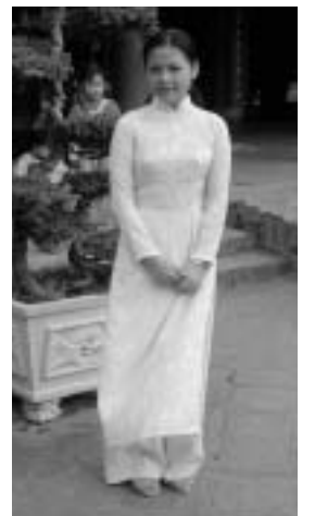
白いアオザイを着た学生さん

ければ今のベトナムはこんな貧しい国じゃなかったかも。そして、国のために亡くなった勇敢な人をとつても尊敬して、感心しています。