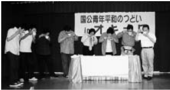
カップラーメン早食い大会