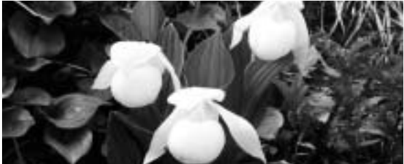
レブンアツモリソウ

2002年 5月26日(日)~30日(木) 6月 2日(日)~ 6日(木) 北海道の大雪山なら1600メートル以上でないと見られない花々が低地で咲き乱れる季節を訪れます。 上記ツアー費用は1月中旬頃発表