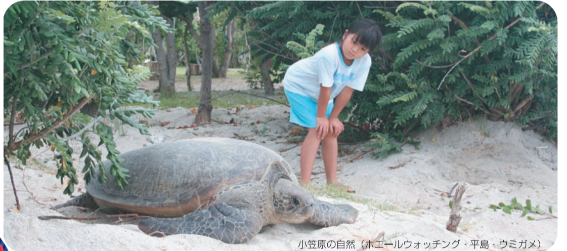
小笠原の自然 (ホエールウォッチング・平島・ウミガメ)