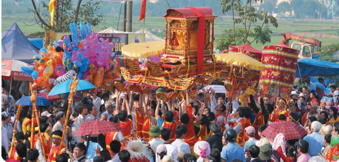
遷都1000年を迎えるベトナム リム祭りの行列と民謡クアンホをうたう未来の歌手たち