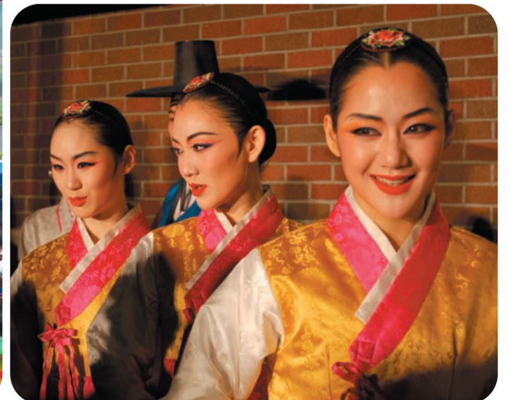
韓国伝統技術舞台—美笑 (MISO)