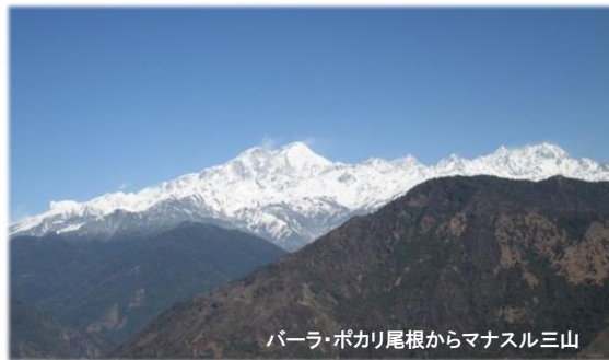
バーラ・ポカリ尾根からマナスル三山