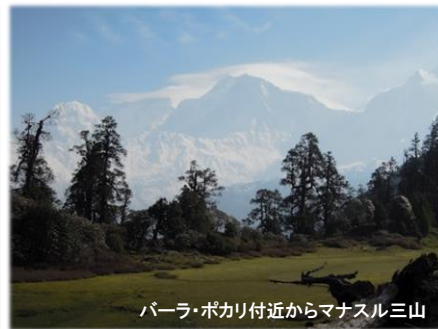
バーラ・ポカリ付近からマナスル三山