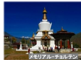
メモリアル・チョルテン