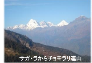
サガ・ラからチョモラリ連山