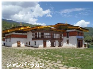
ジャンパ・ラカン