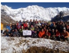
2011/10 アンナプルナ内院