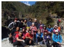
2013.10 ナムチェとタンポチ