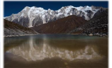
ポンカール湖 4250m に映るマナスル