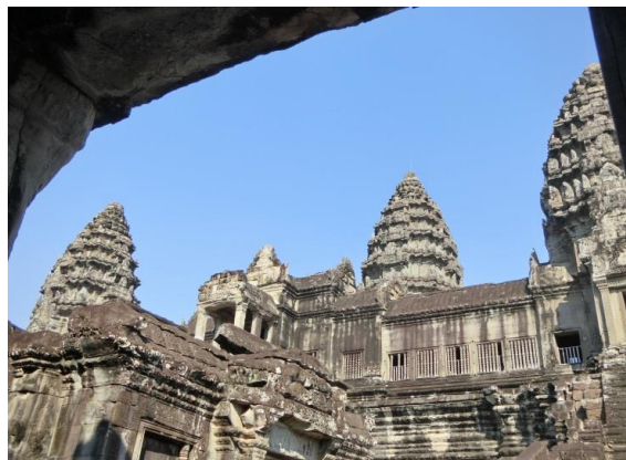
▲ アンコール=ワット