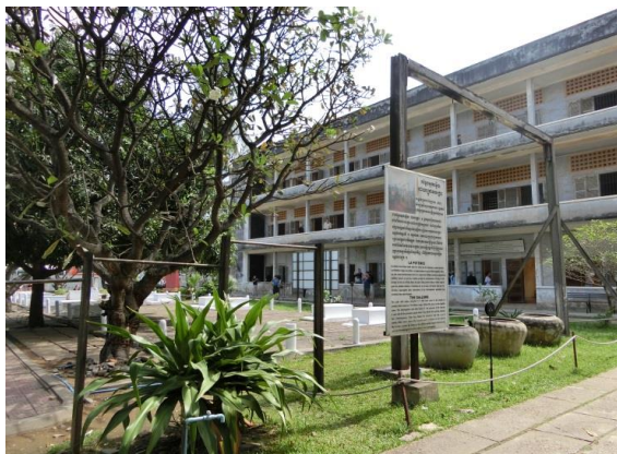
▲ トゥールスレン博物館

超過手荷物料金 クリーニング代、電報・電話代、心づけ・謝礼、追加飲食等の個人的性質の諸費用 空港施設使用料、保安料 成田：2610円 関西：3,010円 お一人部屋追加料金 22,000円 国内における集合・解散地までの交通費・宿泊費 燃油サーチャージ 約 15,320円（2018年8月1日現在） 空港税 約 3,400円（2018年8月1日現在） 渡航手続費用：カンボジア・ビザ取得費用 旅券印紙代 傷害、疾病等に関する医療費、任意の海外旅行保険料