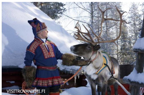
イナリ（先住民族サーミ）