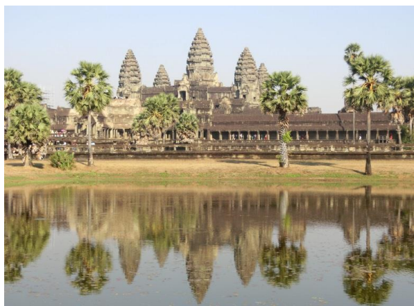
▲アンコールワット