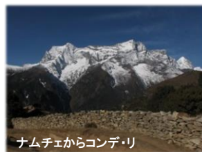
ナムチェからコンデ・リ

2019年11月19日(火)~12月1日(日) 418,000 円/人 東京(羽田・成田空港)発着 他空港はお問合せ下さい