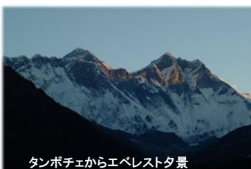
タンボチエからエベレスト景