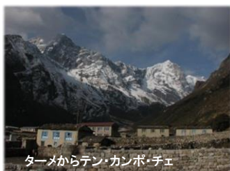
ターメからテン・カンボ・チエ