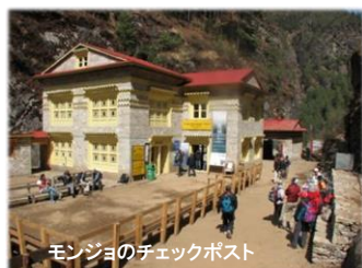
モンジョのチェックポスト

◎ 一般のご旅行条件に加え、ヒマラヤのトレッキング (ハイキング) ツアー特有の条件がございます。「トレッキングツアーに関する特別なお願い」をお渡ししますので必ずお読みになりご了承の上でご参加下さいますようお願い申し上げます