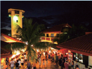
▲チャモロ・ビレッジ

チャモロ・ビレッジにはスペイン統治時代を再現したようなコロニアル様式の小さな建物が集合し、本場のチャモロ料理が味わえるフードスタンドや、お土産店が立ち並び、毎週水曜日の夜にはナイトマーケットが開かれ、ローカルバンドの生演奏やダンスを楽しむことができる。観光客だけでなく、地元住民も多く集まる場となっている。