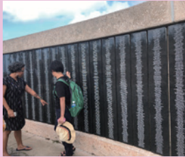
▲アサン展望台にあるモメンリアル