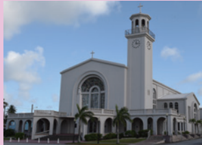
▲聖母マリア大聖堂