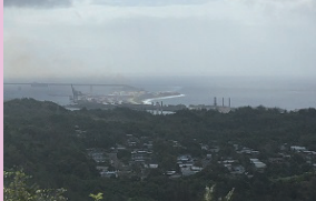
◀アサン展望台から見下ろすアブラ港

アジア太平洋戦争時のグアムや周辺諸国に関しての展示物があります。戦争時の日本軍やアメリカ軍、両方の様々な資料があり、太平洋戦争でいかに多くの犠牲者が出たか歴史について学べる博物館。太平洋戦争国立歴史公園のあるアサンは、日米が激しい戦闘を展開した地。太平洋戦争で米海軍最高司令官だったニミッツ提督にちなんでつけられたニミッツヒルを通って行くとアサン展望台があります。展望台からはアメリカ海軍の軍港があるアブラ港やアサンビーチが見渡せます。