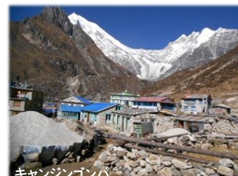
キャンジンゴンパ