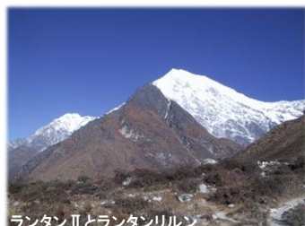
ランタンⅡとランタンリルン