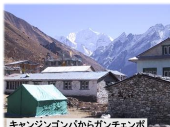
キャンジンゴンパからガンチェンポ