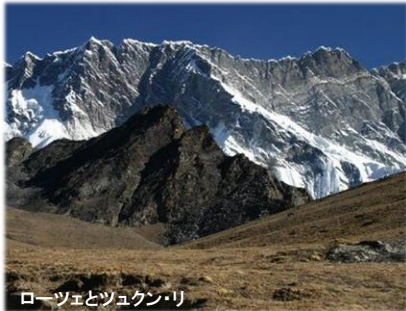
ローツェとツクン・リ