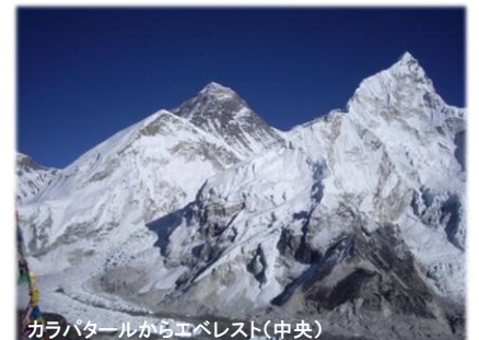
カラパタルからエベレスト(中央)