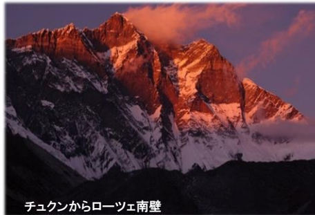
チュクンからローツェ南壁