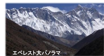
エベレスト大パノラマ

プランの取扱について お客様のご希望に沿って企画、見積、現地手配を行う 受注型企画プラン(手配ツアー) の取扱となります。ここに掲載の内容はご検討用のモデルプランです。お気軽にご相談下さい。