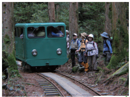
← ↑ 縄文杉までの登山イメージ