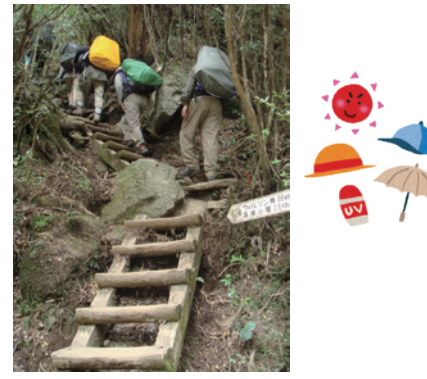
縄文杉までの登山イメージ