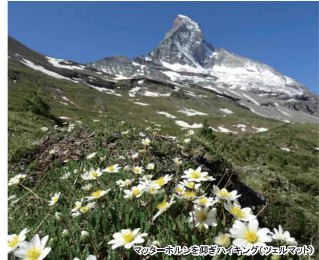
マッターホルンを仰ぎハイキング(ツェルマット)