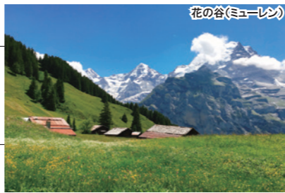
花の谷(ミューレン)

※スイスアルプスツアーでは、以前、荷物託送サービスを利用し、前日にスーツケースを次の宿泊地に発送すると翌日に到着しておりましたが、2018年に規則が変更になり、現在は翌日の到着となりました。そのため、大変恐れ入りますが、旅行中の都市間を列車等で移動する際はご自身で持っていただきます。