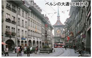
ベルンの大通りと時計塔

スイス連邦の首都であり世界遺産都市。人口は約14万人で、石畳の大通りはヨーロッパらしい中性の面影を残す。熊が市の紋章となっており、ベルンはドイツ語のベレーン(熊の意味)が語源となっている。アーレ川が町をぐるりと取り囲む城塞都市で、シンボルの時計塔は、時刻をつける時マリオネットが動き出す。