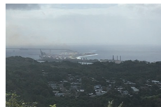
▲アサン展望台から見下ろすアブラ港