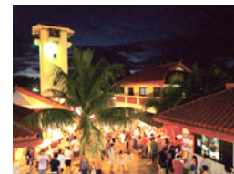
▲チャモロ・ビレッジ

ハガニアにある「チャモロビレッジ」で毎週水曜日の夜に開催されているマーケット。チャモロ料理の屋台やお土産店が立ち並び、ローカルバンドの生演奏やダンスを楽しむことができます。観光客だけでなく、地元住民も多く集まる場となっています。