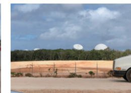
▲建設予定地だった頃のフィネガンの様子(現在の海兵隊基地キャンプ・ブラズ)