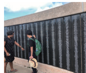
▲アサン展望台にあるメモリアル