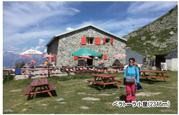
ベラトローラ小屋(2346m)

ヴァレー州アニヴィエ谷に位置するスイスの村。となりのグリメンツとともに、木造建築の家々のバルコニーは主にゼラニウムの花で飾られている。南約5kmの場所にはモアリダムとモアリ湖があり、湖の周辺はハイキングコースも整備されており、高山植物の散策やモアリ氷河の眺望を楽しめる。この辺りはスイスの他の町と比べるとハイカーは少なく日本人に会うことも稀。 谷のまわりには4000m級の山々がたたずみピスホルン（4153m）、ヴァイスホルン（4505m）、ズィナールロートホルン（4221m）、オーバーガーベルホルン（4063m）など展望台からのぞむことができる。この昔ながらのスイスの山の生活が息づいた静かな村でゆっくり過ごすことがお勧め。