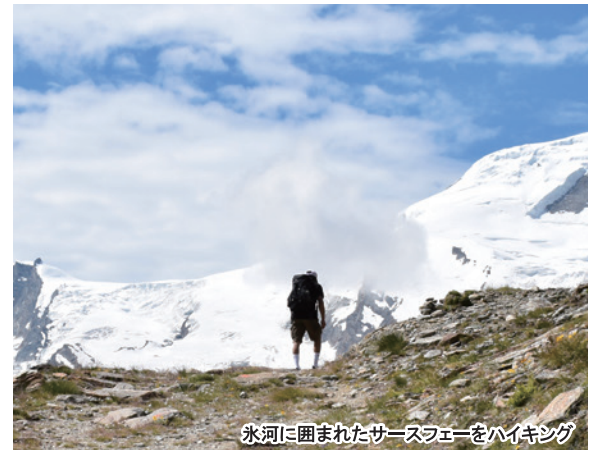
氷河に囲まれたサースフェーをハイキング

ローヌ谷からのびるフィスパ谷に続くサース谷の中心地。スイス国内最高峰のドム、アラリン、テーシュホルン、アルプフェルなどミシャベル山群6つの4000m峰に囲まれる。雄大な氷河を抱く美しい村は“アルプスの真珠”とも呼ばれている。周囲をぐるりと氷河に取り囲まれ、氷河から溶け出したフェー川は河岸をえぐり、村の中心で峡谷をつくっている。また、シュピルボーデンには餌付けされたマーモットがいて人に慣れているので近くで写真が撮れる。町にはケーブルカー、リフトが多数あり、高山植物やアルプスの動物など観察しながらのハイキングができる。ツェルマットと同様、ガソリン車禁止。