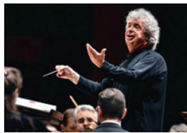
▲セミヨン・ビシュコフ

2025年「プラハの春音楽祭」が開催! 1946年に第1回が開催され、5月12日のチェコの作曲家スメタナの命日を皮切りに、約3週間にわたって開催される伝統の音楽祭。指揮者のセミヨン・ビシュコフは27年ぶりにプラハの春に復帰し、チェコ・フィルハーモニー管弦楽団の首席指揮者として初めてこのフェスティバルの代表作を演奏する。