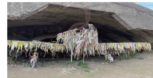
▲耐爆掩体(シェルター)

濟州西南端にあるアルトゥル飛行場跡地は濟州道民を強制動員し、1920年代末から太平洋戦争が終わりに差し掛かった1944年まで旧日本軍の飛行場として建設され、日中戦争当時、中国南京などの爆撃基地として使われました。周辺には、20基ほどの掩体壕、弾薬庫、防空壕、通信施設が畑の中に散在しています。またここにも4・3事件の虐殺現場が存在します。