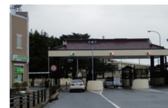
三沢基地 ゲート前▶