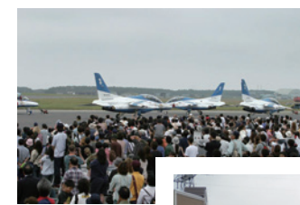
◀三沢基地 航空祭の様子

毎年秋には「航空祭」が実施され、ブルーインパルス等の航空機の展示飛行、外来機の地上展示、各種イベントが行われ多数の観衆が集まりますが、米軍の世界戦略に則って運用されているため、中東などで戦力が必要となれば配備されている戦闘機部隊を派遣することもあります。また米本土から空軍部隊の援軍を中東や南アジア方面に投入する時の中継地としても使用されます。