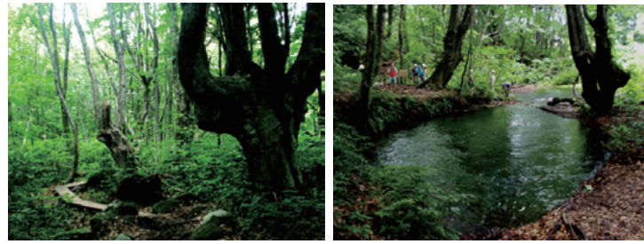
▲出つぼと呼ばれる豊富な湧き水（獅子ヶ鼻湿原）

鳥海山の中腹に広がる湿地帯です。出つぼと呼ばれる大きな湧水口が4つあり、豊富な湧き水を吐き出しています。散策するブナ林は奇怪な姿をしているものがあり、炭焼き用に伐採したブナが奇妙な形で成長を続けた為ではないかといわれています。また世界最大の「鳥海まりも」を見ることができます。