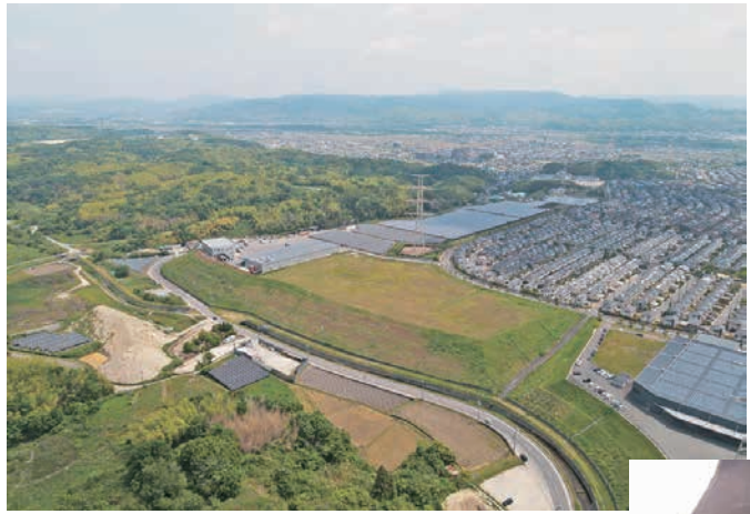
▲左側が祝園分屯地。右側が国会図書館や企業、研究所、ニュータウンがある学研地域

2024年3月、地元議員や住民有志が「京都・祝園ミサイル弾薬庫問題を考える住民ネットワーク（ほうそのネット）」を結成。防衛省への説明会開催要求、学習会、市民への呼びかけを続けています。