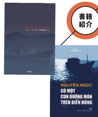
『海のホーチミンルート』(日本語版) 光陽メディア ¥1,500(税別)