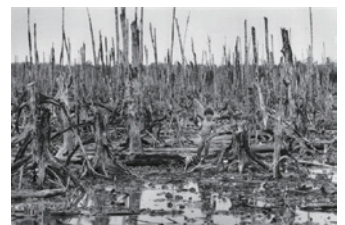
▲戦争証跡博物館にある「カマウの枯死の森」のパネル

戦時中、米軍によって散布された7200万ℓもの枯葉剤には、猛毒のダイオキシンが含まれていました。その後遺症に苦しむ人々は300万人以上といわれ、第二、三世代に生まれた子孫に深刻な身体への影響が出るという被害が今なお続いています。そうした枯葉剤犠牲者の治療自立援助のために開設された施設はベトナムだけでなく世界各地にあります。