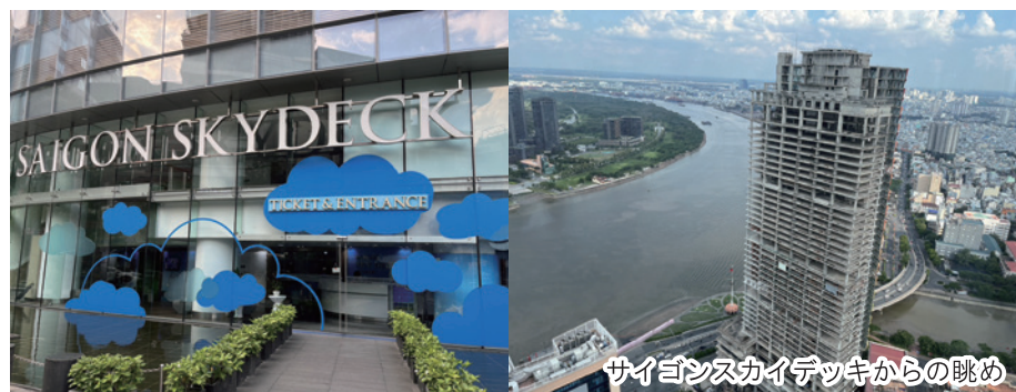
サイゴンスカイデッキからの眺め