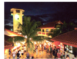
▲チャモロ・ビレッジ

ハガニアにある「チャモロビレッジ」で毎週水曜日の夜に開催されているマーケット。チャモロ料理の屋台やお土産店が立ち並び、ローカルバンドの生演奏やダンスを楽しむことができます。観光客だけでなく、地元住民も多く集まる場となっています。