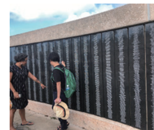
▲アサン展望台にあるメモリアル