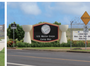
▲海兵隊基地キャンプ・プラズ ゲート前