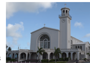
▲聖母マリア大聖堂

ハガニアは太平洋の島々で最も古くから西洋化した町であり、今もグアムの首都です。町の中心部にはスペイン統治時代に建てられたカトリックの大聖堂がたっています。街の随所に旧日本軍の戦跡や、スペイン統治時代の史跡、先史時代の遺跡も点在します。