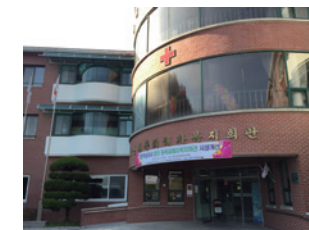
◀ 陝川原爆被害者福祉会館

韓国・釜山から車で2時間ほどの山あいにある慶尚南道陝川（ハプチョン）郡。植民地支配下の朝鮮半島から出稼ぎや徴用、徴兵などで広島と長崎に渡った人々が被爆し、日本の敗戦を経て帰国した被爆者たちが多く暮らしたことから、「韓国のヒロシマ」と呼ばれます。帰国した被爆者たちは援護の枠外に置かれ、病気や差別、貧困に苦しむこととなります。日本政府の支援で建設された被爆者の養護施設「陝川原爆被害者福祉会館」にある原爆死没者の「慰霊閣」には、位牌がずらりと並んでいます。会館横には被爆者らの働きかけによってできた小さな原爆資料館があり、被爆者の証言動画や被爆後の広島を写した写真などを見ることができます。