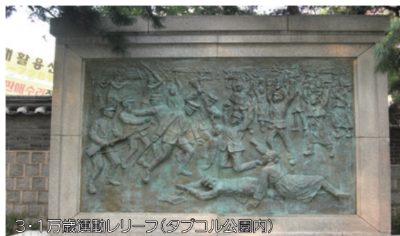
3・1万歳運動レリーフ(タプコル公園内)