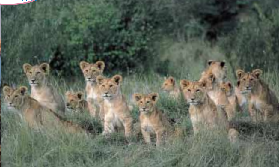
狩りに出た親の帰りを待つ子ライオンたち