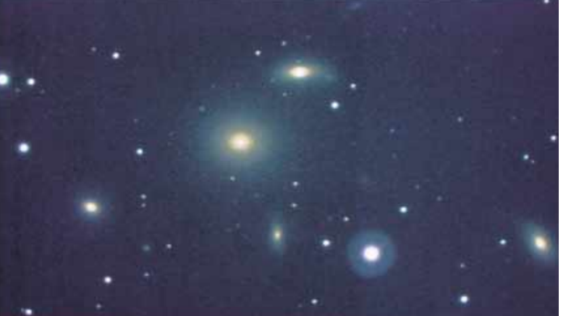
ペルセウス座銀河河

観測に影響があるほど汚染が進んだら、大変なことになります。天文観測はハワイの山頂とか、非常に空気の良いところで行われていますので、現実的には天文学についてはあまり影響を考えないでよいと思います。 しかし、地球の生い立ちを考えると無視できないことです。なぜ地球にこれだけ豊かに生命が生まれてきたかという事です。ひとつに地球が海を持つことが出来たことです。その海で植物が生まれ、そして重要なのは植物が何十億年もかけて光合成を行い、二酸化炭素を酸素に変え、それが大気中にどんどん広がる。そしてまた、その酸素からオゾン層が長い年月をかけて出来上がる。太陽光線の中の紫外線は、生命体を破壊しますが、それを遮断するのがオゾン層です。このオゾン層が出来ることによって、生物が地上に上がり、それから営々と続く進化がはじまったわけです。今このオゾン層を破壊しているということは、時代を逆行しているようなもので、ある意味では、非常に恐ろしいことです。惑星探査でその