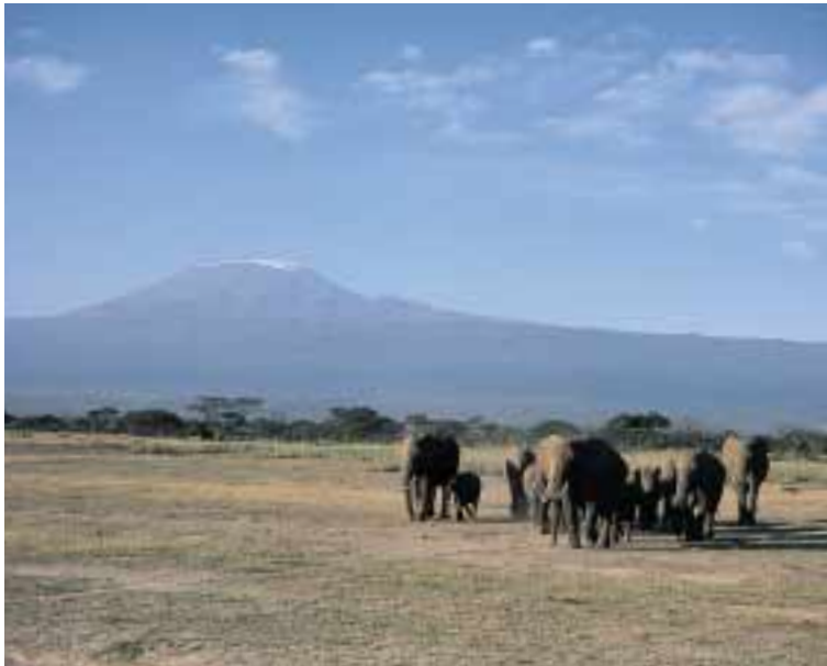
水場へ向かうゾウの群れ 後ろはキリマンジャロ山 (アンボセリ国立公園)

動物たちとの出会い ナクル湖国立公園 コフラミンゴは十一月、オオフラミンゴは三月四月が繁殖の最盛期といわれている。 マサイマラ国立保護区 毎年夏、南側のセレンゲティ国立公園から百万頭といわれる「ヌー」の大移動が入ってくることで知られている。 アンボセリ国立公園 アフリカ最高峰キリマンジャロ山の眺めが美しいのは一月、ゾウの群れとの組合せで有名。