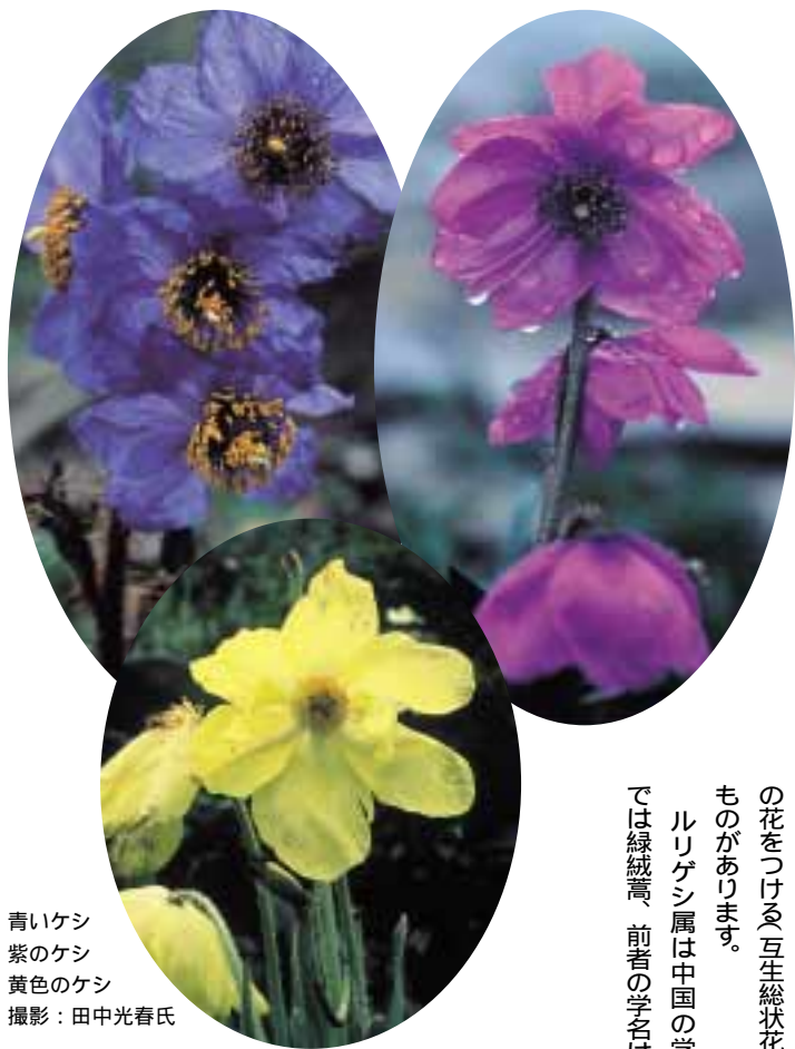
青いケシ 紫のケシ 黄色のケシ

四川の秘境・九寨溝と黄龍 山の花だけが、中国の自然 の魅力ではありません。多彩な 水の色をもつ湖沼や滝は、まさ に自然のつくりだした神秘。九 年代にベールを脱いだ新しい 四川省の自然美です。