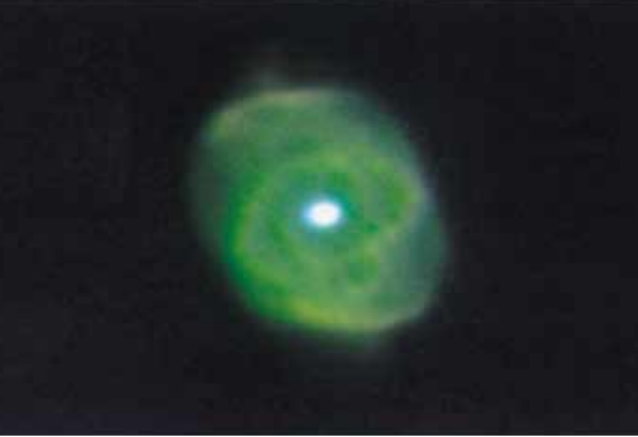
キャッツアイ星雲