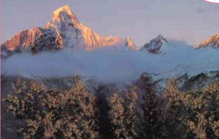
四川省 四姑娘山 6,250m

中国の自然「幻の花・青いケシ」を探して 5面 カラー特集 「サファリは人類を見直す修学旅行」 4面