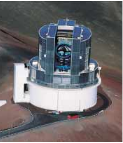
ハワイ・マナウケア山頂のすばる望遠鏡

観測に影響があるほど汚染が進んだら、大変なことになります。天文観測はハワイの山頂とか、非常に空気の良いところで行われていますので、現実的には天文学についてはあまり影響を考えないでよいと思います。 しかし、地球の生い立ちを考えると無視できないことです。なぜ地球にこれだけ豊かに生命が生まれてきたかという事です。ひとつに地球が海を持つことが出来たことです。その海で植物が生まれ、そして重要なのは植物が何十億年もかけて光合成を行い、二酸化炭素を酸素に変え、それが大気中にどんどん広がる。そしてまた、その酸素からオゾン層が長い年月をかけて出来上がる。太陽光線の中の紫外線は、生命体を破壊しますが、それを遮断するのがオゾン層です。このオゾン層が出来ることによって、生物が地上に上がり、それから営々と続く進化がはじまったわけです。今このオゾン層を破壊しているということは、時代を逆行しているようなもので、ある意味では、非常に恐ろしいことです。惑星探査でその