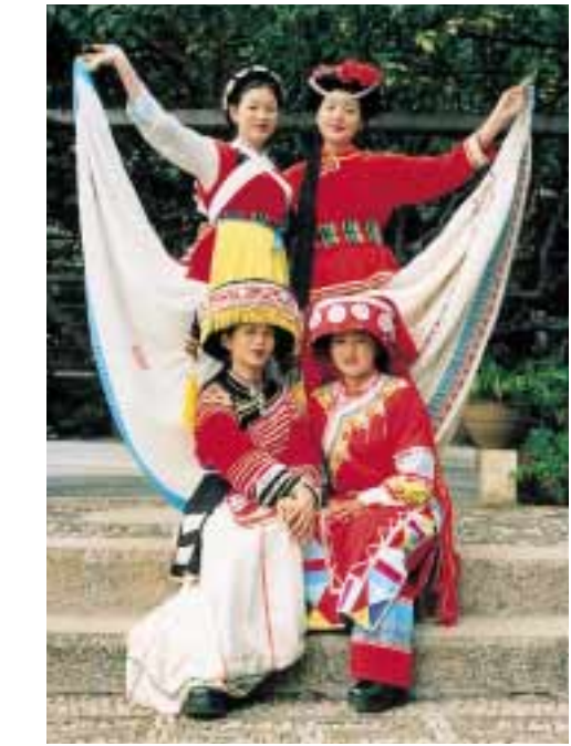
雲南省の少数民族