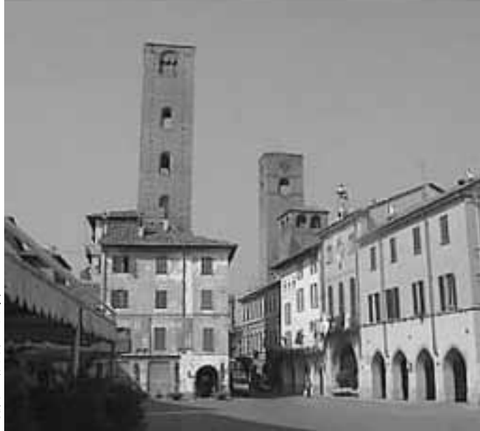
アルバの中世の塔と柱廊

北イタリアのアルバは、ピエモンテ州の州都トリノから南へ六五km、ランゲ・ロエロ地方の中心都市のひとつで人口三万たらずの小都。東西一、五、南北一、二キロの旧市街に教会、四つの修道院、三つの塔、市庁舎などの中世の建物がそそり立ち、その間を網の目のように小道がはしる。中世の建物の周りには柱廊がありレストラン、カ