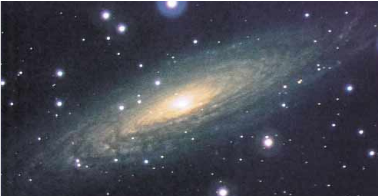
銀河 NGC 2613

「遠くを見ること」は、はるか昔をみることに「(ビデオ)宇宙の果てに挑む」国立天文台編、宇宙の研究によって、宇宙の始まり、地球の生い立ちも分かると言われていきますが、はるか遠くにある天体をとらえる意味についてお話しください。 遠くを見ることは、はるか昔をみることに、まさしくその通りですね。光の速度が有限だということからきています。天体を見るというのは、それが放つ光をキャッチすること。光が到達するまで時間がかかる。ということは必ず過去の姿を観ていることになり。身近な例をあげると、月の光が地球に到達するまでに約一秒かかり、太陽だと約八分かかります。つまり一秒前の月、八分前の太陽を我々は見ているのです。 さらに遠くになると、皆さんもご存じのアンドロメダ銀河は、二二〇〇万光年の彼方になります。これも二二〇〇万年前の姿を見ているということになります。まだホモサピエンスが存在する前の大昔です。遠くになればなるほど、光は微弱になります。すばる望遠鏡など観測技術の進歩によって、五〇億光年、一〇〇億光年離れた天体をキャッチ出来るようになってきました。 宇宙のはるか昔の姿、距離によって各時代の姿が見えるわけで、宇宙の歴史を知ることが出来ます。我々の銀河もどのようにして出来たかも分かるわけです。 太陽系が出来たのが約五〇億年前、そして約四五億年前に、原始地球が生まれたと聞いています。 地球の生い立ちを研究する方法は二つあります。一つは地球そのものの内部を調べることです。もう一つは、星が生まれつつあるところを観測することです。五〇億光年も遠くを見なくても、我々の銀河の中でも星が生まれようとしています。 一般的に我々が星とって見えるのは恒星のことで、自分で輝くことが出来る星です。惑星系というのは、その恒星を中心に回りを回っています。従って星が生まれようとしているところを探し、惑星の形成過程を見ることができ