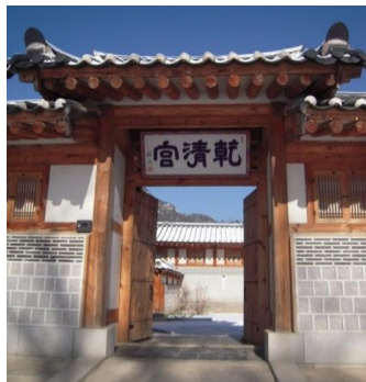
▲世界遺産・景福宮、乾清宮（右）…閔妃の暗殺現場