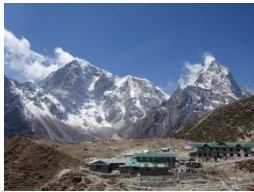
トゥクラからロブチェへ