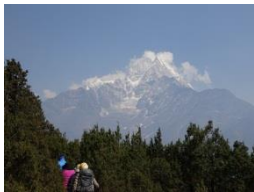
タムセルクを見ながら