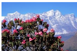
石楠花とコンデ・リ山群

このガイドについては、年寄相手なので親切、日本語が少し分る、緊急時には抱えて降りてくれるような屈強な男性、という希望を申し込んだ処、予想以上に素晴らしいガイドを紹介された。出掛ける前から「イケメンだよ」という旅行会社の情報に期待した。その通り、振り返っては、優しい目で「〇〇さん、頑張ってください！」と言われると元気が出た。行程中も高山病にならないための対処法、疲れしないための歩き方等指導を受けて、全員が目標達成した一番の要因である。