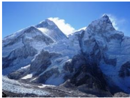
眼前にエベレスト(カラパタールから)