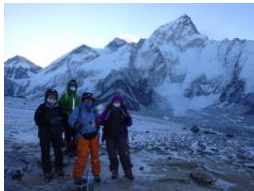
四人組 遂にカラパタール登頂

高度順応には、次のステップの高度まで経験し、その日は200m~300m下まで降りて宿泊する。これを繰り返して高度を上げていく。一日に500~700mだけ高度を上げる。