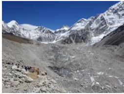
ゴラクシェブはもうすぐ