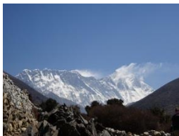
バンボチェからエベレスト