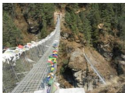
ラージャ・ドバンの吊橋