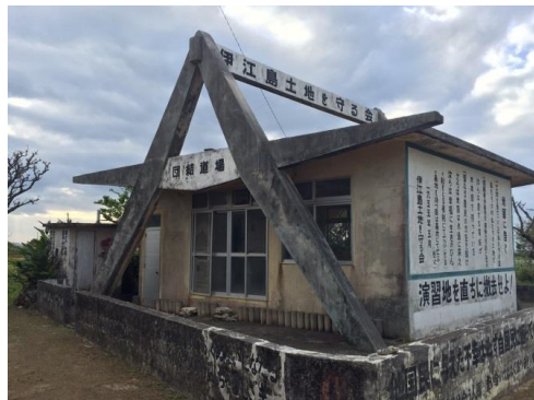
伊江島・団結道場