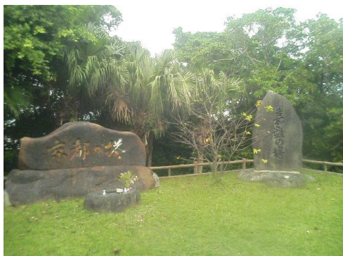
嘉数高台、京都の塔