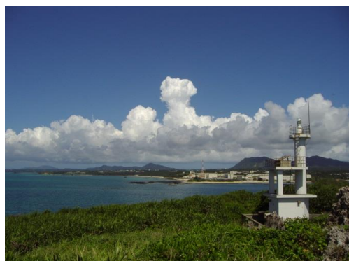
辺野古沖よりキャンプシュワブ