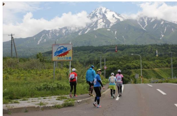
景色を眺めながら自分のペースで