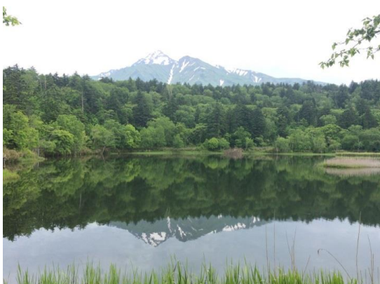
姫沼からの利尻富士